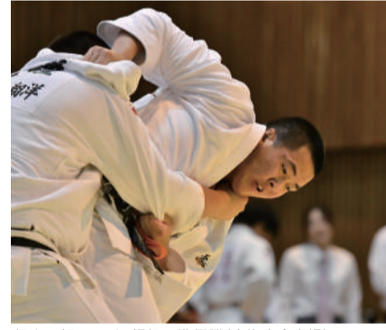
個人部 100kg超級 準優勝(東海大会出場)

以前、私は藤枝明誠ニュース116号にて下剋上を誓いました。5月18日、私に残されたチャンスの1つ目である高校総体県大会予選を迎えました。勝ち進んだ決勝戦開始10秒で一度投げられた際、右