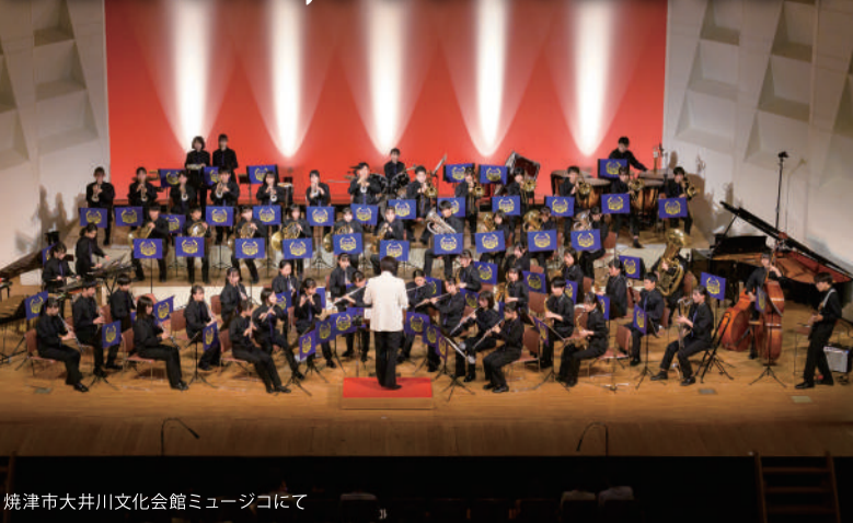
焼津市大井川文化会館ミュージコにて